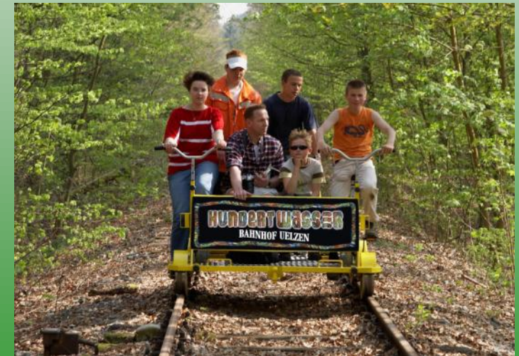
Mit der Fahrradraisine von Dannenberg zum Hundertwasser-Bahnhof Uelzen - eine mögliche Nutzung für die stillgelegte Bahnstrecke zwischen Ostheide und Elbe

Eine Möglichkeit wäre, die Bahnverbindung von der Ostheide zur Elbe in Zukunft erneut zu nutzen - sei es als Draisinen- oder Museumsbahn, um den Tourismus in unserer Region nachhaltig zu fördern, oder sogar für den öffentlichen Nahverkehr, um die Straßen vom Verkehr und die Luft von CO 2 zu entlasten.